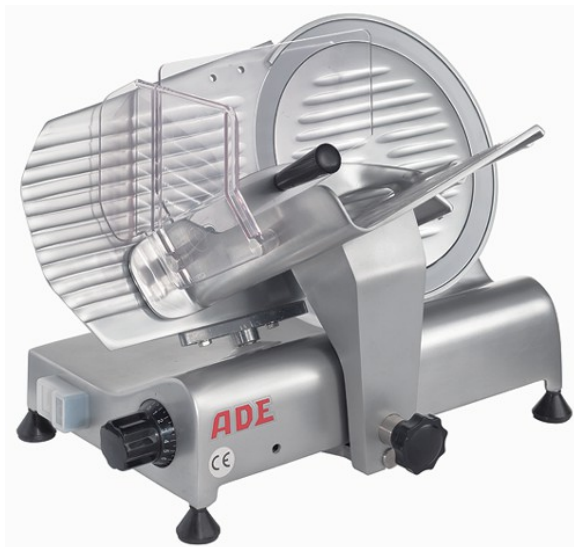
HANSE 250 (HANSE 300) A = 260 (320) mm, B = 400 (450) mm

C = 340 (440) mm, D = 410 (475) mm, E = 475 (580) mm